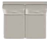
Lille 2 pers. (E3) med 2 sædepuder B 108 x D 89 cm