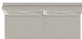
Stor 3 pers. (F3) med 2 sædepuder B 194 x D 89 cm