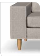
Ben 251 – 15 cm Eg/olie