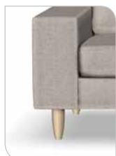
Ben 251 – 15 cm Bøg/sæbe