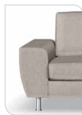
Arm 6 25 cm