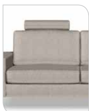
Nakkepøje 55 cm/65 cm/80 cm