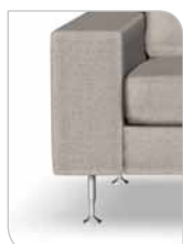
Ben I – 15 cm