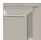
90° Hjørnemodul (HJ) B 87 x D 87 cm