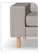
Ben 252 – 15 cm Eg/olie