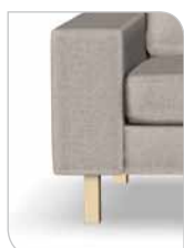
Ben 252 – 15 cm Bøg/sæbe