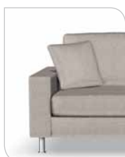
Deko pude 113