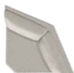
90° Hjørnemodul maxi (HM) B 105 x D 105 cm