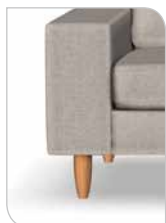
Ben 251 – 15 cm Bøg/kirsebær