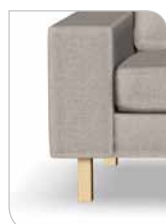
Ben 252 – 15 cm Bøg/lak