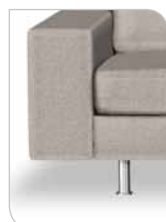
Mulighed for placering af ben under sædet