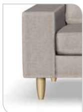
Ben 251 – 15 cm Bøg/lak