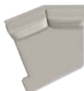
Hvilemodul venstre (83) B 130 x D 135 cm (Kræver armlæn)