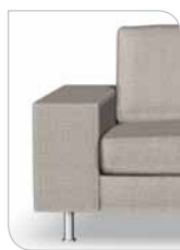
Arm 4 26 cm