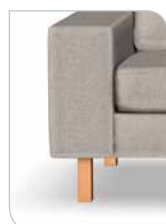
Ben 252 – 15 cm Bøg/kirsebær