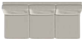
Stor 3 pers. (C3) med 3 sædepuder B 194 x D 89 cm