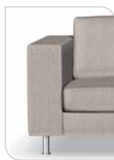
Arm 2 21 cm