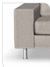
Ben F – 13 cm