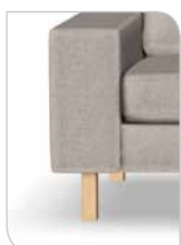
Ben 252 – 15 cm Eg/sæbe