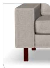
Ben 252 – 15 cm Bøg/mahogni