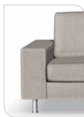
Arm 5 21 cm