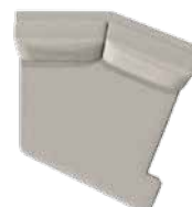
Hvilemodul højre (84) B 130 x D 135 cm (Kræver armlæn)