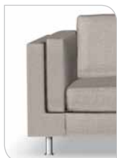
Arm 8 25 cm