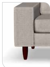
Ben 251 – 15 cm Bøg/mahogni