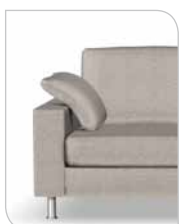
Deko pude 115