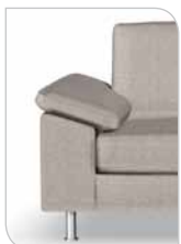
Arm 9 21 cm