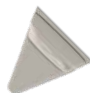
45° Hjørnemodul (HH) B 82 x D 89 cm