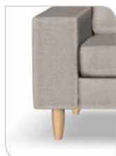
Ben 251 – 15 cm Eg/sæbe