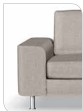
Arm 7 21 cm