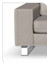
Meder – 14 cm