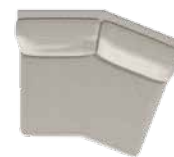
30° Hjørnemodul (88) B 118 x D 105 cm