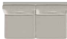
3 pers. (33) med 2 sædepuder B 161 x D 89 cm