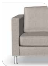
Arm 1 11 cm