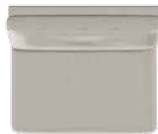
Lille 2 pers. (D3) med 1 sædepude B 108 x D 89 cm