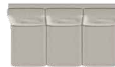
3 pers. (G3) med 3 sædepuder B 161 x D 89 cm