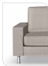
Arm 3 16 cm