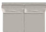
2 pers. (23) med 2 sædepuder B 130 x D 89 cm